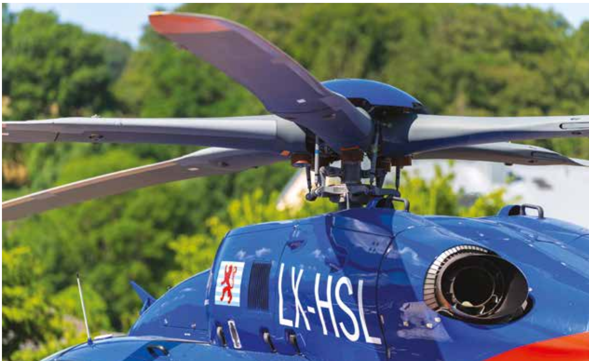
LX-HSL: Der zweite Teil des Kennzeichens steht für „Helping Save Lives“.

La machine est également équipée de moteurs plus puissants qui permettent d'augmenter la charge. Les équipes de secours peuvent du coup emporter du matériel médical supplémentaire et répondre encore mieux aux besoins des patients. En outre, le H145 D3 possède une cabine plus spacieuse. Les équipes médicales disposent ainsi d'une plus grande liberté de mouvement pendant le vol, ce qui leur permet de prodiguer les meilleurs soins aux patients.