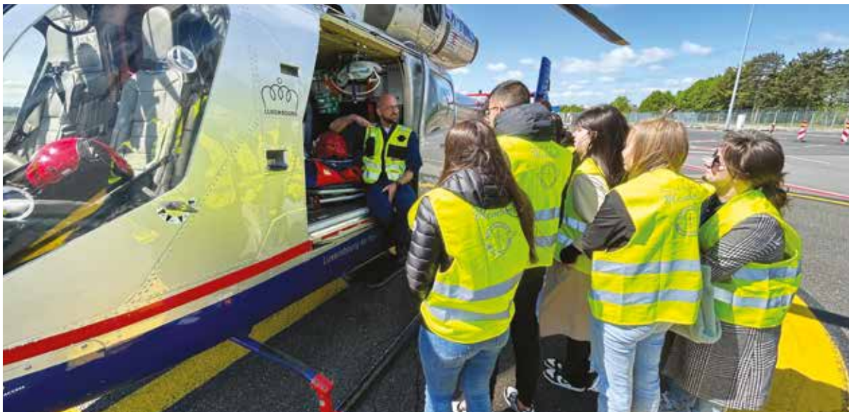
Lycée Technique pour Professions de Santé