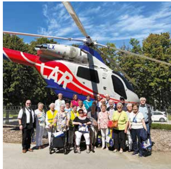
A.G.E.P. Biissen asbl.