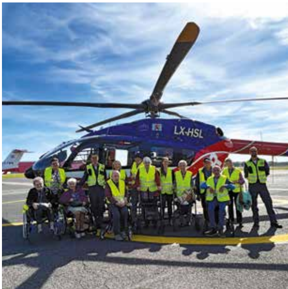
SERVIOR – MS Centre "Geenzebléi"

Si vous avez envie de nous rendre visite avec votre club, entreprise ou organisation, contactez-nous par e-mail à : redaction@lar.lu