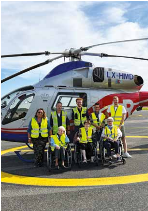
Hôpital Intercommunal Steinfort