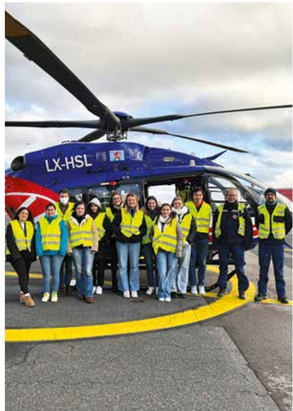
Medezinstudenten - Uni Lëtzebuerg