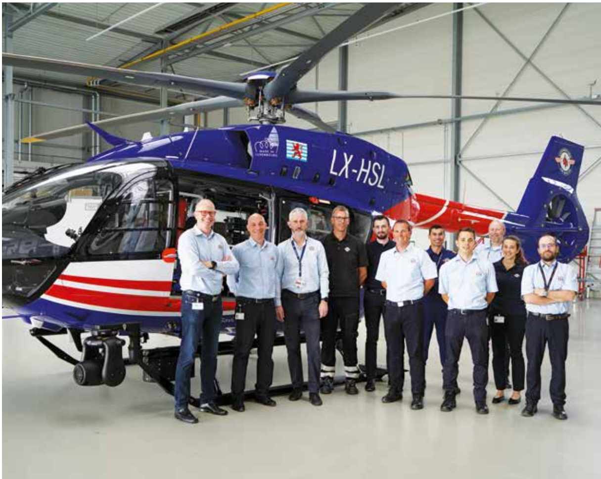
Un travail d'équipe : le H145 D3 et son nouveau design ont été conçus en collaboration avec les experts de LAR.

En y regardant de plus près, on découvre des étoiles placées tout autour du Fenestron. Elles symbolisent d'une part la situation géographique du Luxembourg, au cœur de l'Europe, et d'autre part l'aide et la coopération transfrontalières. De quoi refléter parfaitement la mission de LAR : sauver la vie de personnes en détresse médicale et préserver leur santé. Avec le H145 D3, LAR sera à l'avenir parfaitement équipée pour cette mission exigeante.