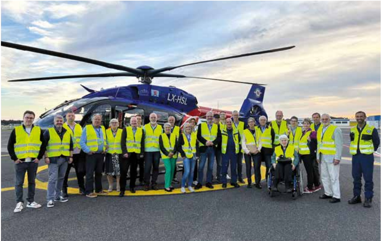
Rotary Club Saarlouis-Untere Saar