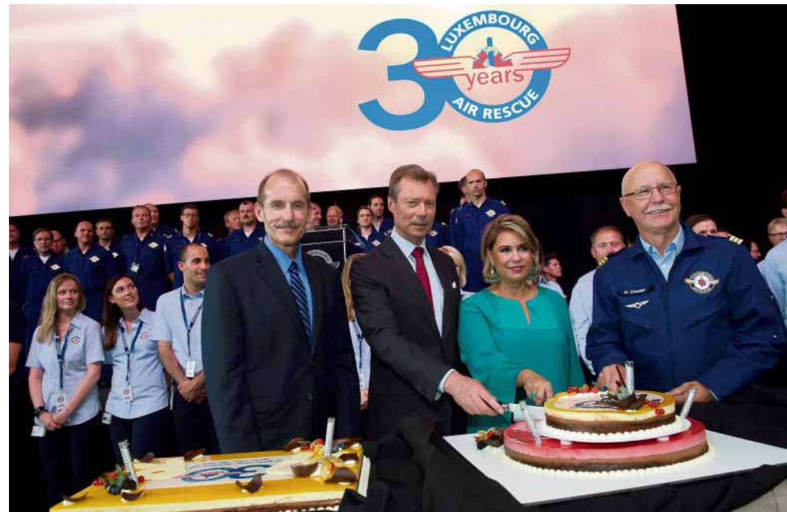
Prominenter Besuch zur großen Feierstunde: US-Pilot Jeff Skiles, das großherzogliche Paar und Air-Rescue-Chef René Closter schneiden die Geburtstagstorte an

Tageblatt Seite 31 / Nr. 126 Freitag, 1. Juni 2018