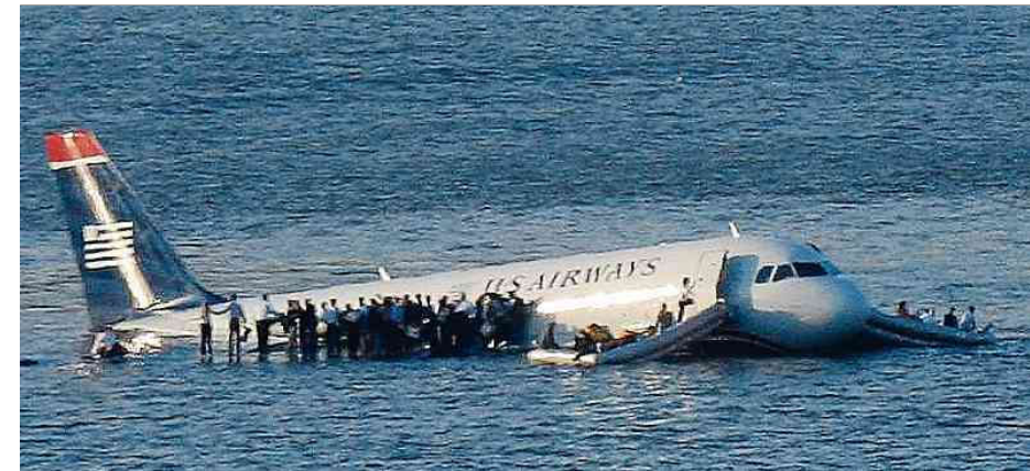
Alle 155 Menschen an Bord von US-Airways-Flug 1549 überlebten die Notwasserung.

Besitzen die Flugzeuge denn gute Segelfähigkeiten? Sie werden überrascht sein, aber trotz der Größe des Flugzeuges sind es gute Segler, dank der geschwungenen Flügel. Kleine einmotorige Maschinen schneiden da