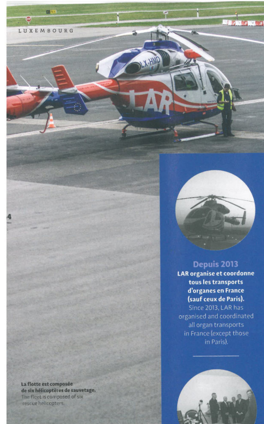
La flotte est composée de six hélicoptères de sauvetage. The fleet is composed of six rescue helicopters.

il est pleinement fonctionnel pour notre personnel, mais aussi pour le cabin crew de Luxair, par exemple. Bientôt, ce sera également le cas pour d'autres corps de métier, tels que des entreprises, voire même le grand public, ayant un besoin spécifique de formation aux gestes de premiers secours.