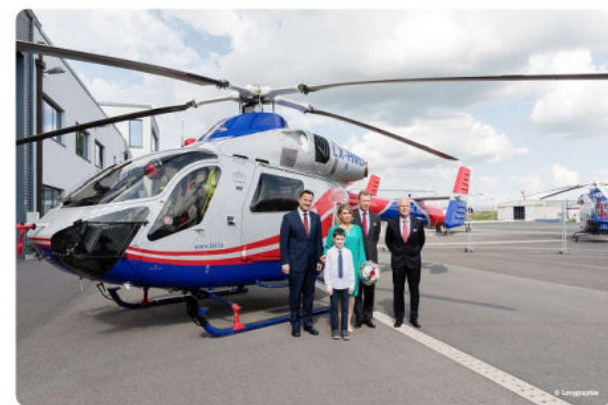
Luxembourg Air Rescue 30th anniversary.

Luxembourg and the Greater Region participated in the birthday celebration at Findel airport. Proceedings opened with a speech by Prime Minister Xavier