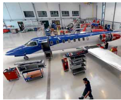
Luxembourg Air Rescue dispose de 5 Learjet 45XR dont le prix d'achat tourne autour des 14 millions d'euros l'unité.

Régulièrement, Luxembourg Air Rescue ouvre ses portes au public pour faire découvrir ses diverses missions. Les prochaines occasions auront lieu les 21 et 28 juin.