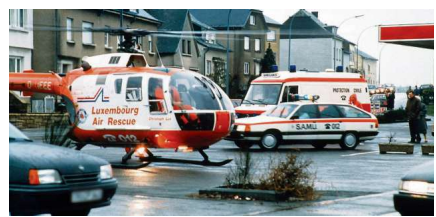
1991: Integration in den SAMU