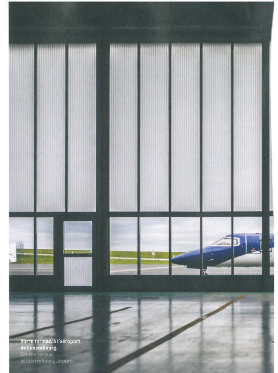
Sur le tarmac, à l'aéroport de Luxembourg. On the tarmac at Luxembourg airport.

En plus, LAR agit en tant que partenaire officiel de l'Onu et de l'Otan, en étroite collaboration avec le ministère luxembourgeois de la Coopération et de l'Action humanitaire ainsi que la Commission européenne, afin d'intervenir sur le terrain lors de catastrophes naturelles ou humaines qui exigent la présence rapide