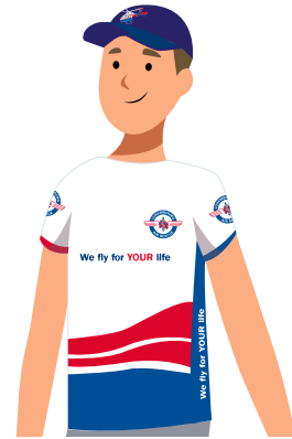
Casquette « LearJet » ou « Heli » 16 €