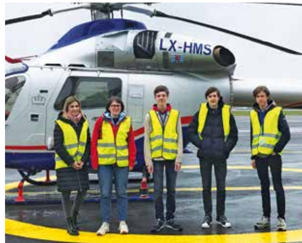
Athénée de Luxembourg