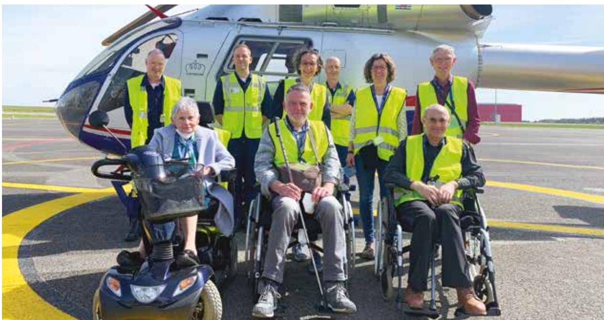
Multiple Sclérose Lëtzebuerg