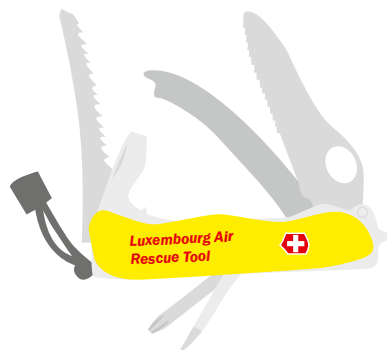
Victorinox Rescue Tool 75 €