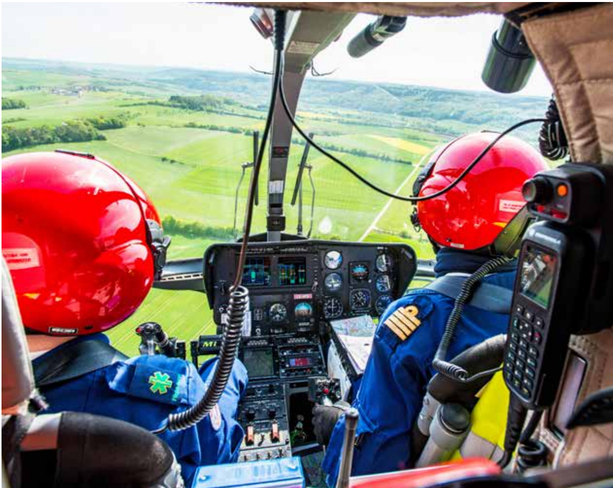
Teamwork ist gefragt: Der Intensivkrankpfleger unterstützt den Piloten bei der Auswahl eines geeigneten Landeplatzes.