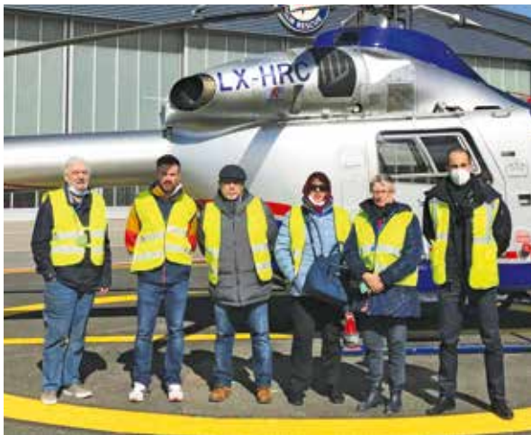
Diddelenger Haus fir Senioren A.s.b.l.