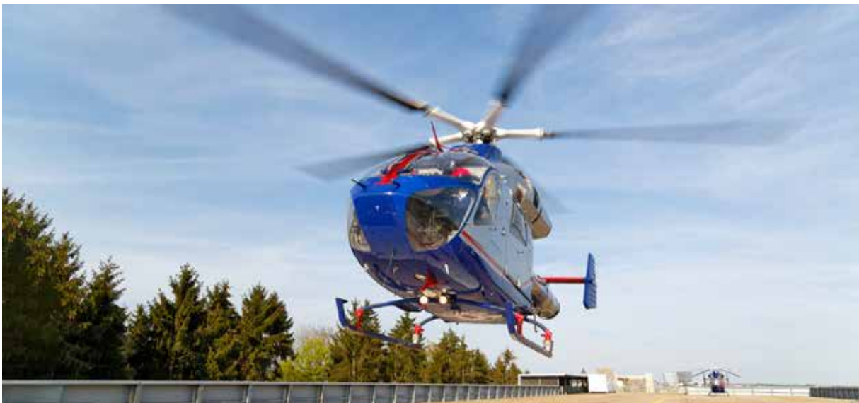
Après seulement quelques minutes de vol, l'hélicoptère Air Rescue 1 se pose sur le toit de l'hôpital.

« Selon la "Golden Hour of Trauma", démontrée par plusieurs études internationales, les victimes d'accidents ont les meilleures chances de survie et de rétablissement si elles sont transportées en douceur à l'hôpital dans l'heure qui suit l'accident, afin de recevoir des soins définitifs », explique le médecin urgentiste Paris Kontokostas. Grâce à la rapidité de l'aide aérienne, Cristelle a effectivement pu être transportée à l'hôpital en moins d'une heure. Ces précieuses minutes ont probablement contribué à la sauver de dommages encore plus graves. Nous souhaitons à Cristelle tous nos vœux pour un rétablissement rapide et complet.