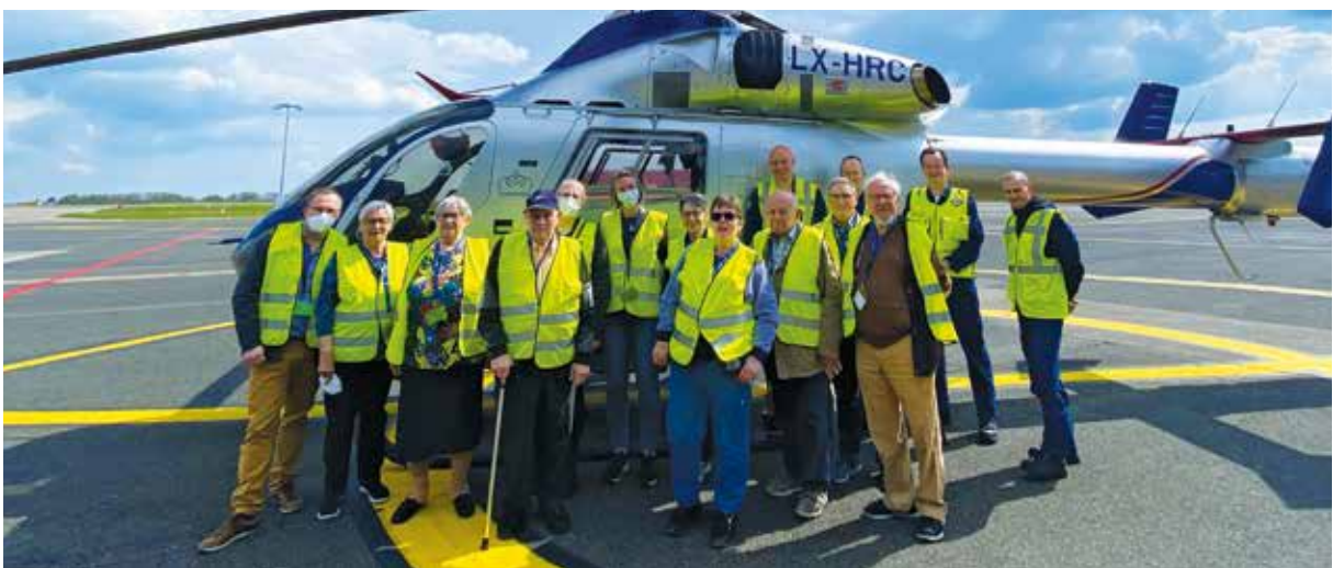
Servior - Résidence Seniors 'Liewensbam' Troivierges