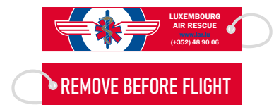
Porte-clés 3 €

Bestellen Sie online auf lar.lu oder per E-Mail: shop@lar.lu Commandez en ligne sur lar.lu ou par e-mail : shop@lar.lu