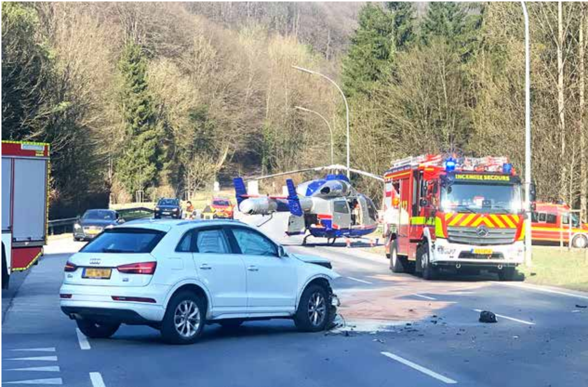
Dem LAR-Hubschrauber gelingt die Landung direkt am Unfallort. Die enorme Beschädigung des Pkw lässt die Wucht des Zusammenpralls mit dem Motorrad erahnen.