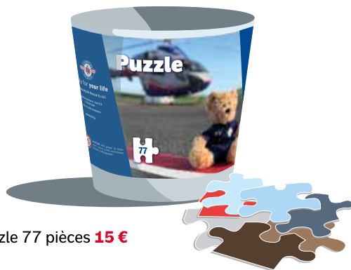
Puzzle 77 pièces 15 €