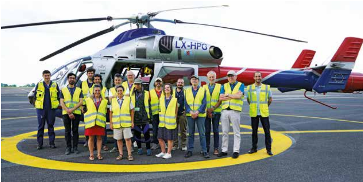
Diariesof magazine readers

Si vous avez envie de nous rendre visite avec votre club ou organisation, contactez-nous par e-mail à : redaction@lar.lu