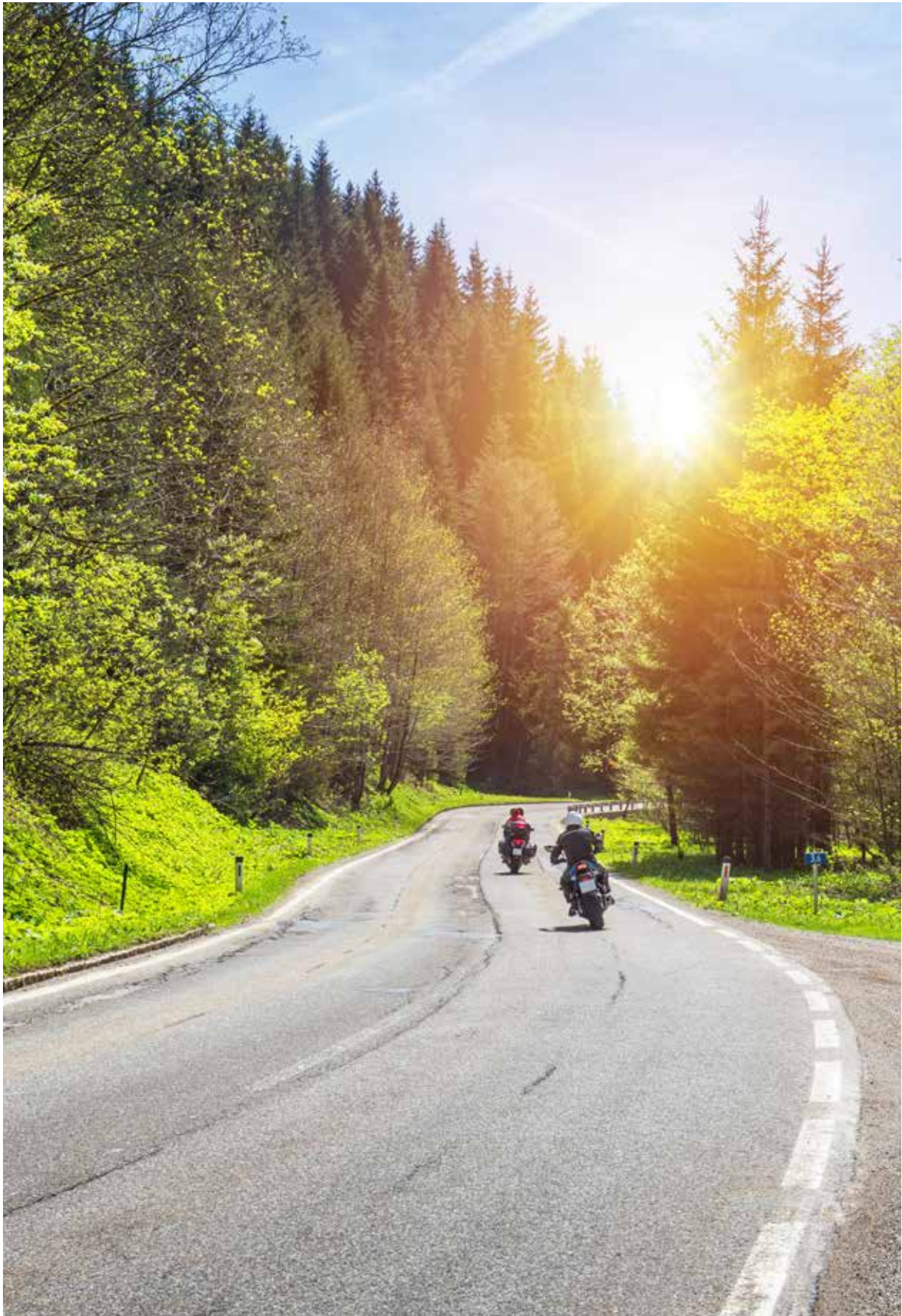
Das malerische Müllerthal ist ein beliebtes Ausflugsziel für Motorradfahrer.