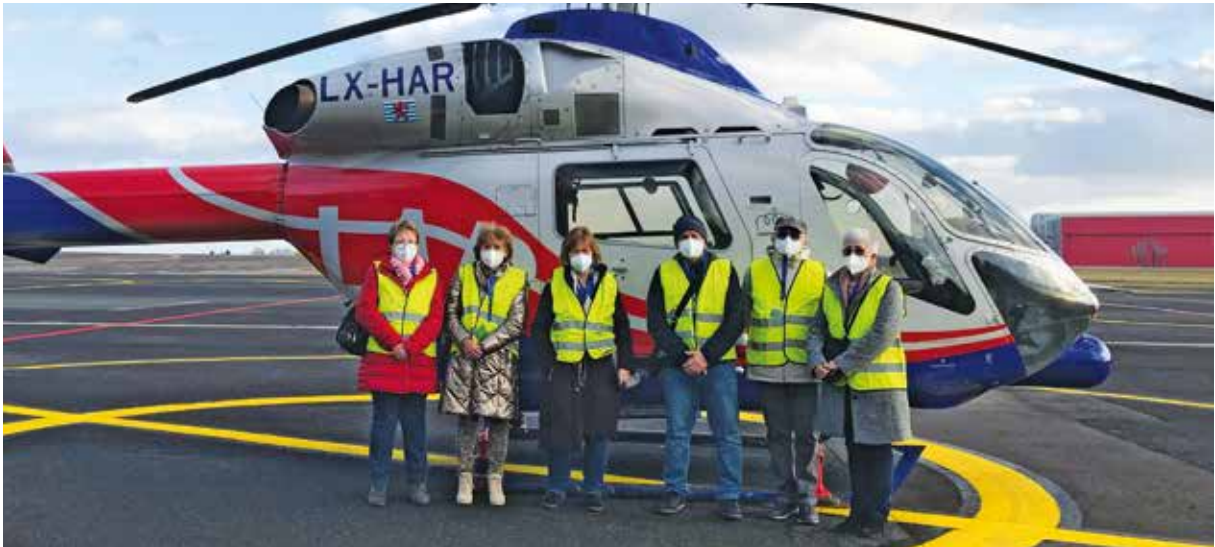
Club Senior Uelzchtall