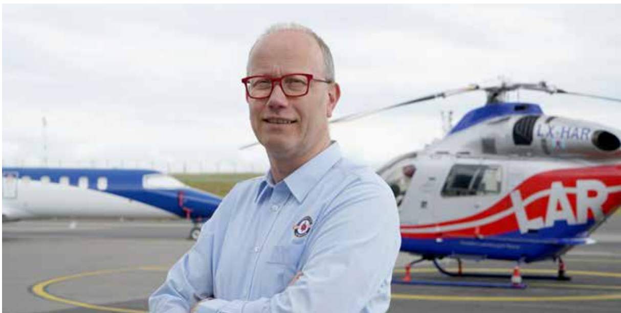
Der Geschäftsführer verantwortet eine Flotte modernster Rettungshubschrauber und Ambulanzflugzeuge.