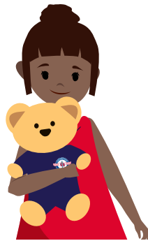
« Captain Teddy », ours en peluche, 30 cm 16 €