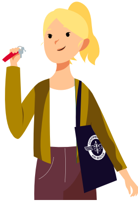
Sac à bandoulière en coton 9,90 €