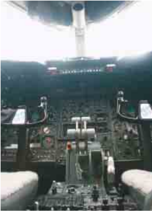
Haupt-Arbeitsplatz der LAR-Jetpiloten: das Lear-Jet-Cockpit