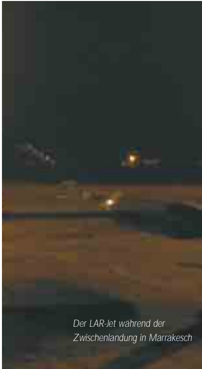
Der LAR-Jet während der Zwischenlandung in Marrakesch

cherheitsstufe, denn zur gleichen Zeit ist der König von Marokko am Flughafen. Doch trotz der hohen Zahl an Sicherheitsbeamten gibt es zügig Treibstoff für den LAR-Jet. In solchen Situation sind gute Kontak-