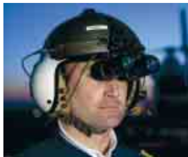
Die LAR ist neben der Schweizer REGA in Europa die einzige Rettungsflugwacht, der erlaubt wird, mit Nachtsichtgerät zu fliegen

Der LAR-Learjet war am Nachmittag erst von einem Ambulanzflug aus England zurückgekommen; um 18 Uhr ging der 112-Anruf bei der LAR ein. Bereits eine dreiviertel Stunde später startet der Lear-Jet nach Lyon, dank der konzentrierten und professionellen Flugvorbereitung der LAR-Operation Manager. Ankunft in Lyon: eine Stunde später, um 19 Uhr. Eine Kontaktperson bringt das Gegenmittel zum Flugzeug und übergibt es dem Piloten. Minuten später startet der LAR-Jet in Lyon, um bereits um 21 Uhr in Luxemburg zu landen, wo das rettende Mittel von der Protection Civile in Empfang genommen wird. „Schnelle Hilfe aus der Luft!“ einmal anders!