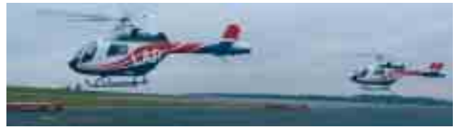
Abend: Die beiden Hubschrauber landen auf der LAR-Basis am Findel