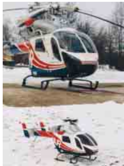
Original und Modell: Der kleine LAR-Hubschrauber ist detailgetreu nachgebaut worden

600 Umdrehungen in der Minute. Die Spezialität: Wie das Original, so fliegt auch der Mini mit dem Typspezifischen NOTAR-System, das heißt: ohne Heckrotor. Zu beobachten ist der ferngesteuerte Hubschrauber zwischen Olm und Nospelt auf einem freien Feld. Dort treffen sich regelmäßig die Mitglieder des „AMO“-Clubs (Aero Modelisme Olm). Für weitere Informationen steht Alain Lehnert jederzeit zur Verfügung – einfach anrufen unter 30 01 99.