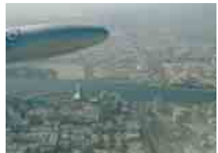
Der LAR-Jet über den Dächern von Dubai auf dem Weg zurück in die Heimat

Klimaveränderungen schlagen vor allem älteren Menschen oft auf die Gesundheit, so wie in diesem Fall: Eine schwere Lungenentzündung zog sich ein 86-jähriger Mann beim Besuch seiner Kinder in Dubai zu. Einzige Überlebenschance: sofort zurück ins gewohnte Klima. Die LAR holte den Mann ab und brachte ihn – unter Begleitung seiner besorgten Frau – in ein heimatliches Krankenhaus.