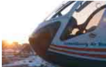
Der Rettungshubschrauber auf dem Dach der Zitha-Klinik kurz vor Sonnenuntergang