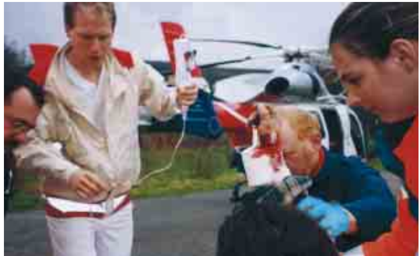
Die verletzte Hand muss so schnell wie möglich behandelt werden, um Folgeschäden zu minimieren

Ein 40-jähriger Mitarbeiter einer Fensterbaufirma zog sich beim Einsetzen von Fensterscheiben tiefe Schnittwunden zu. Sehnen, Nerven und eine Arterie waren in Mitleidenschaft gezogen. Ein Druckverband stillte zuerst einmal die Blutung, und dank schneller Hilfe der LAR, die den Patienten in eine Spezialklinik nach Trier flog, konnte die Hand des Mannes fachgerecht behandelt werden.