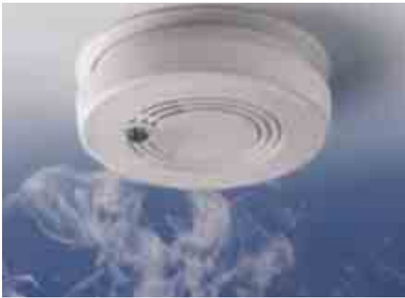
Trifft Rauch auf den Rauchmelder, schlägt dieser Alarm

Im Großherzogtum Luxemburg starben in den letzten 10 Jahren über 40 Menschen durch Feuer und Rauch. Besonders nächtliche Brände sind gefährlich: zwei Drittel aller Brand-