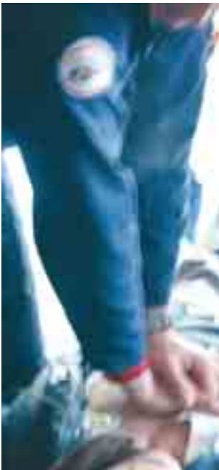
Ein Patient muss wiederbelebt werden