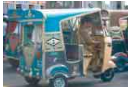
Karatschi: Eindruck auf dem Weg zur Klinik