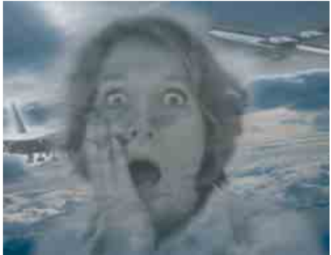
Fliegen – für viele ein Alptraum...

die folgenden Symptome beobachtet: Feuchte Hände, schweißgebadeter Körper, Herzrasen, Kurzatmigkeit, Appetitlosigkeit, Übelkeit, Erbrechen und Panikattacken. Viele der unter Flugangst leidenden Menschen meiden einfach das Fliegen. In der heutigen Zeit sind damit aber teilweise so große berufliche und soziale Nachteile verbunden, dass es kaum möglich ist, sich auf