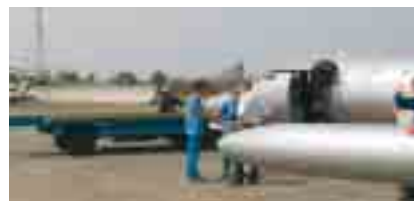
Die Crew wartet auf die Freigabe der Landepiste. Flughafenmitarbeiter hatten den Weg zur Startbahn mit einem mobilen Gepäckförderband blockiert

Doch dann will ein Handling Agent des Flughafens noch ein zweites Mal Landegebühr abkassieren und blockiert den Learjet mit einem mobilen Gepäckförderband. Guckert geht daraufhin zum Airport-Chef und regelt den Fall. Und dieser zeigt glücklicherweise kein Verständnis für den Korruptionsversuch seines Mitarbeiters. Nicht ganz unproblematisch ist auch der Tankstopp beim Rückflug in Marrakesch: Es ist dunkel, das Rollfeld wird grell beleuchtet. Es zählt oberste Si-