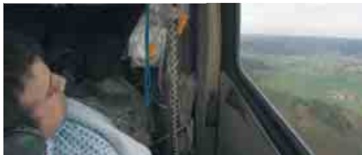
Einsatz mit Christoph 2: Tolle Aussicht für den Patienten