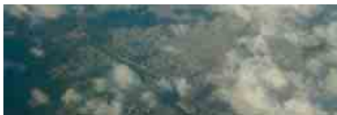
Anflug auf Paris