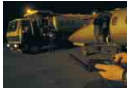
Der LAR-Jet während eines Tankstopps. Der Pilot kontaktiert per Satellitentelefon das LAR-Bodenpersonal und gibt seinen Standort durch

Kleines Tier, großer Schaden: Ein 32-jähriger Angestellter wurde während seines Aufenthaltes auf den Seychellen von einem nicht identifizierten Insekt ins Bein gebissen. Die Folge: schwerer allergischer Schock, Luftnot, Schaum vorm Mund, Kreislaufkollaps. So schnell wie möglich musste der Mann in eine Spezialklinik. Die LAR-Crew holte ihn ab und flog den intubierten und beatmeten Patienten in ein einheimisches Krankenhaus, wo ihn ein Ärzteteam bereits erwartete.