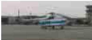
Mit einem UN-Hubschrauber wird der Patient eingeflogen

cherheitsstufe, denn zur gleichen Zeit ist der König von Marokko am Flughafen. Doch trotz der hohen Zahl an Sicherheitsbeamten gibt es zügig Treibstoff für den LAR-Jet. In solchen Situation sind gute Kontak-